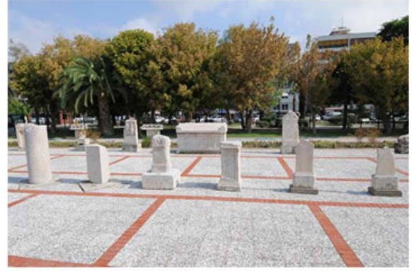
Bostanlı açık hava müzesinden bir görünüm

İzmir'in ve çevredeki antik kentlerin binlerce yıldır ev sahipliği yaptığı uygarlıkların kronolojik bir senaryo çerçevesinde sergilenmesi ve ziyaretçilere sesli ve geceleri ışıklı bir elektronik rehberlik hizmeti ile sunulması çok önemli bir görsel zenginlik yaratacaktır. Böylelikle, İzmir'e gelen ve Efes vb. ören yerlerine gitmeye fırsat bulamayan kruvaziyer turistleri başta olmak üzere ziyaretçilere kentin merkezinde müthiş bir sanatsal ve arkeolojik deneyim yaşatma fırsatı bulunabilecektir. Bostanlı'da 1987' de kurulan ve yakın zamanda kapsamlı bir tadilat geçiren açık hava müzesi bu bağlamda güzel bir örnektir. Bu müze son zamanlarda kruvaziyer ile gelen ziyaretçilerin de ilgisini çekmektedir.