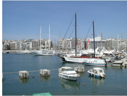
Lizbon - Portekiz