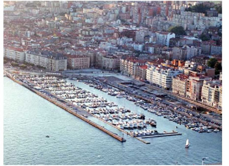
Santander - İspanya