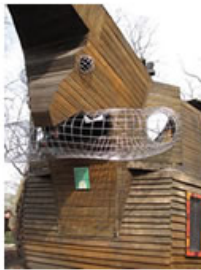
Berlin - Çocuk oyun parkından bir örnek