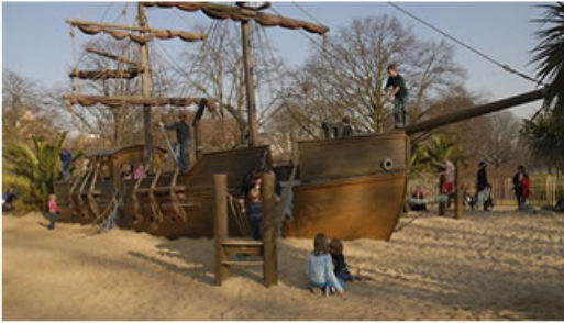
Ahşap bir çocuk oyun parkı (Korsan gemisi)

Çocukların deniz, doğa, ağaç, çiçek ve hayvan sevgisini pekiştirecek, onlarla bütünleşmeleri sağlayacak ve çevre bilincini geliştirecek objelerin ağırlıkta olduğu temalı parklara sadece Kordon'da değil çeşitli semtlerde mevcut ve yeni yapılacak semt parklarının içinde yer verilmesinin çocukların sağlıklı gelişimi ve kentte yaşamının getirdiği çevre ve doğaya yabancılaşma sorununa bir ölçüde çözüm getireceği inancındayız. Bilinçli ve uzmanlık gözönüne alınarak seçilecek temalara dayalı oyuncak objeler çocukların hayal güçlerinin ve yaratıcılıklarının gelişmesi, arkadaşlarıyla takım oyunları ile iletişim kurmaları açısından yararlı olacaktır.