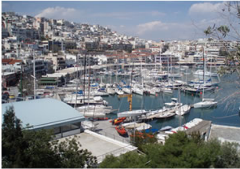
Pire - Yunanistan

Dünya'nın bütün büyük şehirlerine baktığımızda denizde hem ihtiyacı karşılayan hem de şehre ayrı bir hava katan irili ufaklı marinalar mevcuttur. Deniz gerçek bir tutkudur, İzmirli de geleneksel olarak denizi sever. Burada yapılacak marina veya marinaların içinde oluşturulacak sosyal yaşam alanları da halkın denize daha da yak inlaşmasına katkı sağlayacak deniz sevgisini arttıracaktır.