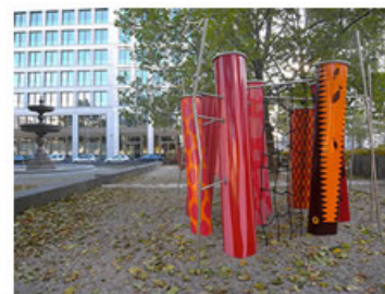
Berlin'de bir çocuk oyun alanı