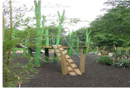
Hyde Park Londra- çocuk alanı