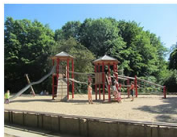
Berlin - Çocuk oyun parkı