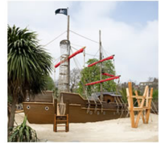
Kensington Gardens- Londra çocuk oyun alanı